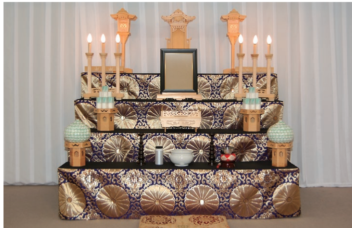
祭壇サイズ 幅 1,800 mm 金欄四段飾り