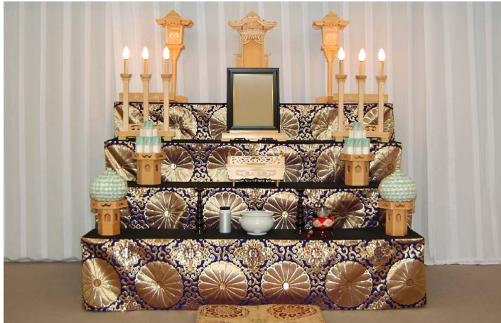
祭壇サイズ 幅 180cm 金欄四段飾り

記録帳、ローソク・線香 (各1箱) お香、香炭 祭壇後幕 (540cm×270cm)